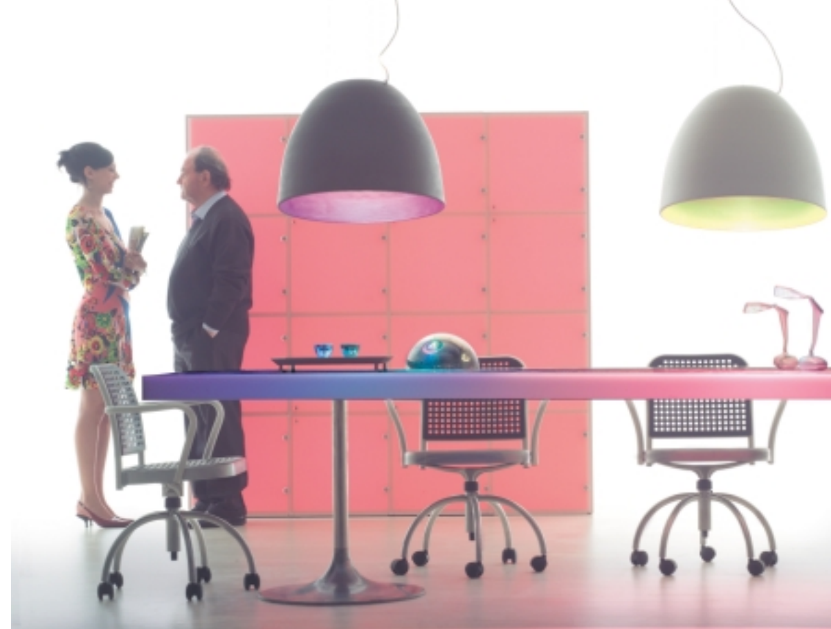
METAMORFOSI-TECHNIK IN NEUER ÄSTHETIK: NUR

TIAN XIA IST DER CHINESISCHE AUSDRUCK FÜR „UNTER DEM MIT STERNEN BESÄTEN FIRMAMENT“.