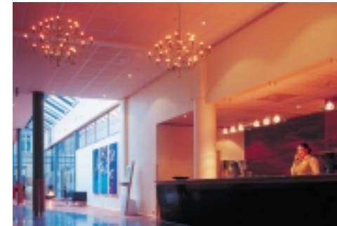
Hotel Quality Toensberg, Oslo Hängeleuchte 2097 (Flos; Design: Gino Sarfatti) Hängeleuchte Lastra 6 (Flos; Design: Antonio Citterio)