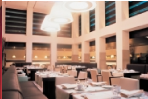
Hotel Dorint am Gendarmenmarkt, Berlin Sonderhängeleuchte (Flos; Design: Light Contract) Hängeleuchte Romeo Soft (Flos; Design: Philippe Starck)